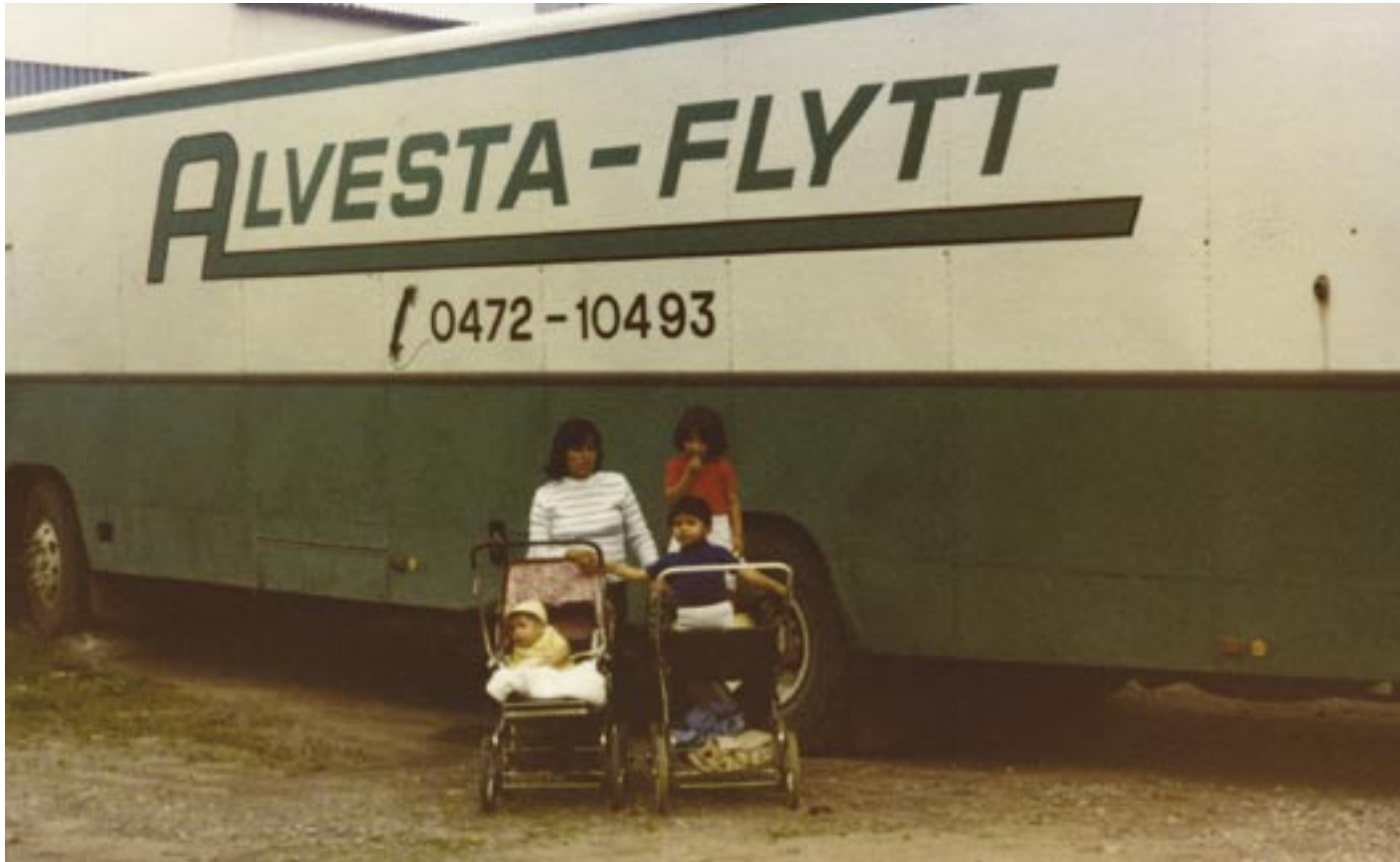
Familjen Vega i Alvesta 1981.

Nordiska museet har ett stort arkiv som bevarar människors egna berättelser om sina liv för framtida generationer. Nu kan din livshistoria bli en del av detta arkiv!